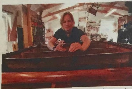
Et større møbel, der skal igennem en stor restaurering, men så virker den også 150 år endnu.